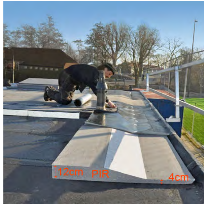
Gootoplossing bij extra dikke isolatie op plat dak.