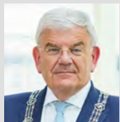
Jan van Zanen

Burgemeester en voorzitter van de gemeenteraad.