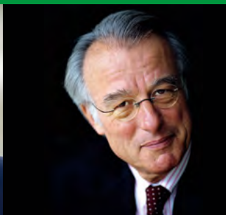
Jozias van Aartsen burgemeester