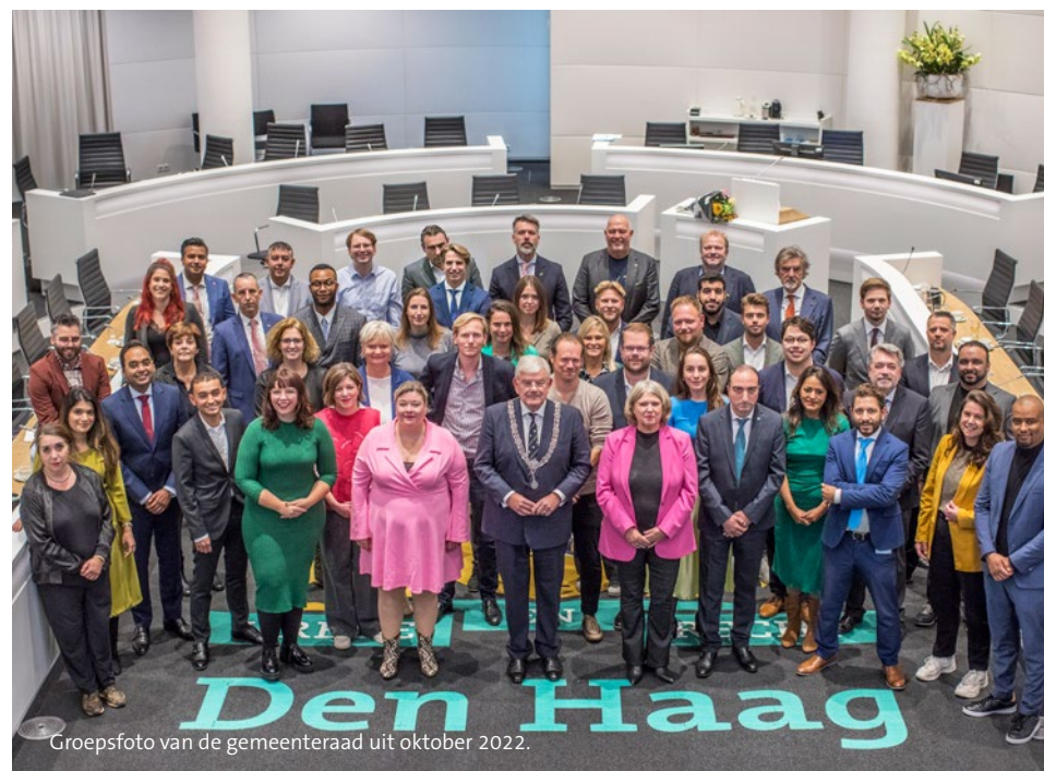
Groepsfoto van de gemeenteraad uit oktober 2022.