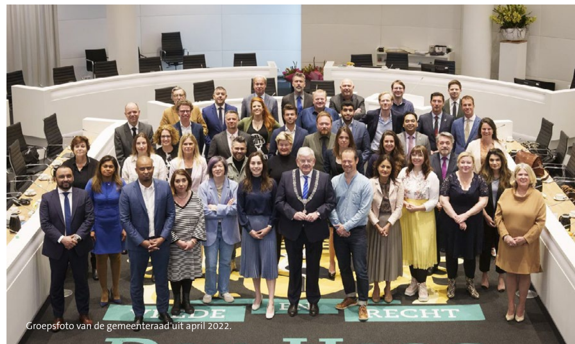
Groepsfoto van de gemeenteraad uit april 2022.