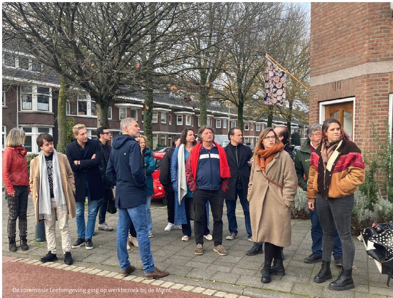
De commissie Leefomgeving ging op werkbezoek bij de Mijnt.

Bij de werkbezoeken aan Den Haag FM in Amare en aan de Campus Den Haag van de Universiteit Leiden kregen commissieleden een toelichting van de mensen uit het werkveld op de werkwijze en ontwikkelingen rondom deze onderwerpen.