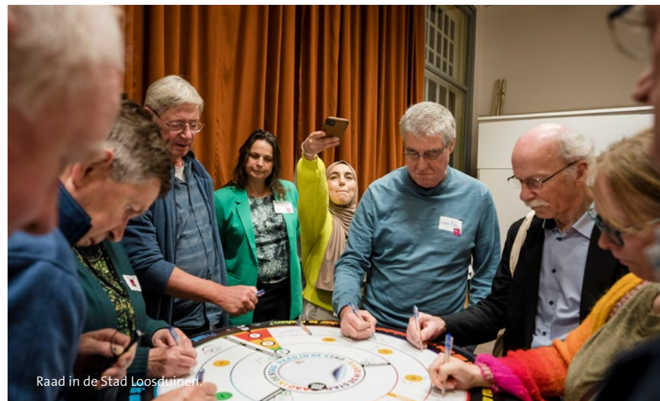
Raad in de Stad Loosduinen.

Om kinderen voor te lichten over democratie en gemeentepolitiek ontvangen wij regelmatig schoolklassen in de raadzaal. In 2022 hebben wij een pilot gedaan, waarin we in samenwerking met ProDemos het