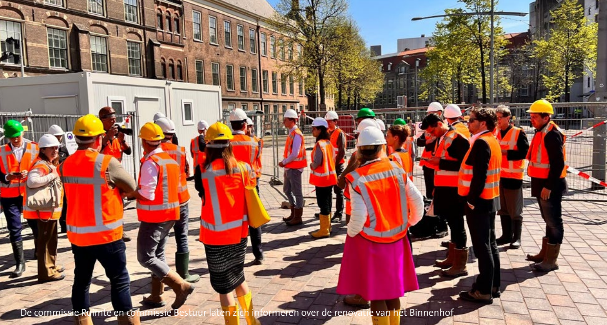
De commissie Ruimte en commissie Bestuur laten zich informeren over de renovatie van het Binnenhof