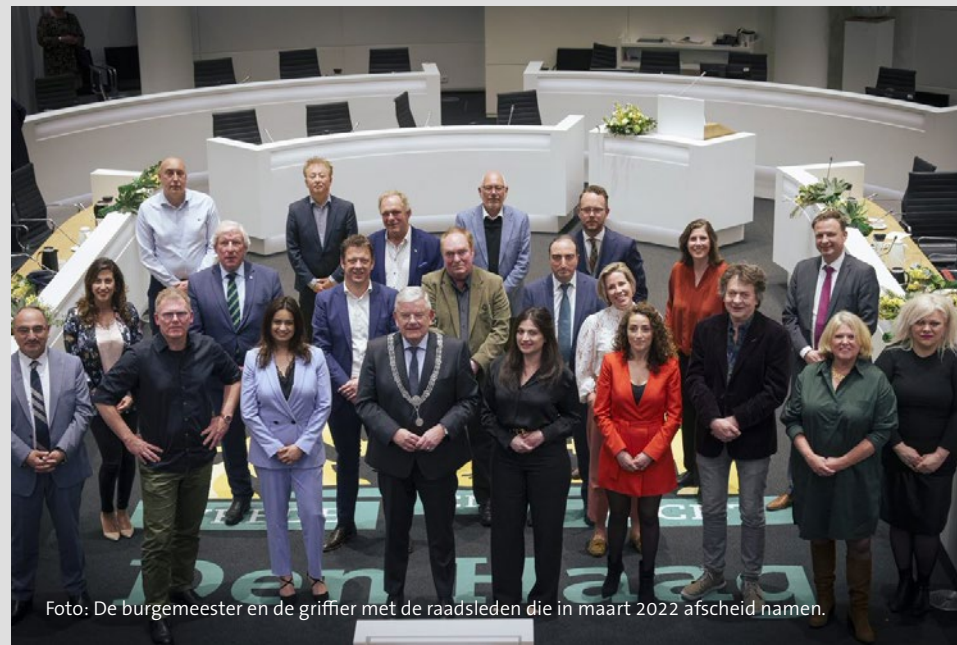
Foto: De burgemeester en de griffier met de raadsleden die in maart 2022 afscheid namen.